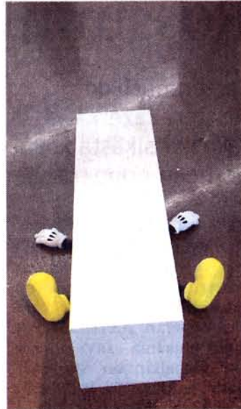
Jiri Geller: Do Not Touch The Artwork , 2009, maalattu hartsi.

Tummasävyisissä kuvissa valo on punaista ja tapaamispaikat autioita. Englanninkielinen tutustumisfraasi on kuvitettu tavanomaisten kohtaa-